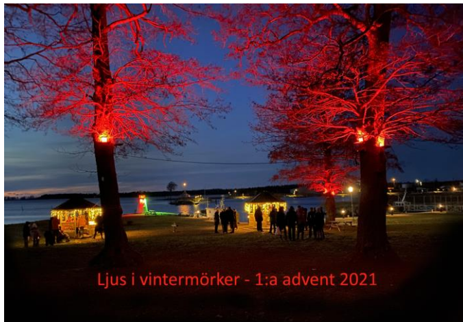
Ljus i vintermörker - 1:a advent 2021

Ljus i vintermörker den 28 november i Badängsparken. Inför arrangemanget hade Pia, Björn och Benny från styrelsen monterat ledstrålkastare med möjlighet till digital färgväxling i några av parkens träd. De bägge lusthusen hade försetts med jordade eluttag och kransar av ljusslingor. Vid skymningen tändes belysningen upp liksom veden i eldkorgarna. I det ena lusthuset tog tomten emot barnen och delade ut julklappar, i det andra serverades glögg, saft och pepparkakor. Ett 50-tal otterbäckenbor höll ut i den kalla kvällsvinden för lite umgänge och julmys.