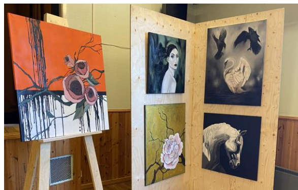
13 konstnärer ställde ut över 200 verk

Höstsalong den 26 september i Folkets Hus. Höstsalongen var ursprungligen en del av aktiviteterna i Leaderprojektet. Efter projektets avslutning har Byalaget tagit in arrangemanget i det egna programmet. Årets salong ingick som en del av "Konst och kultur i Gullspångs kommun". På utställningen deltog 13 konstnärer med över 200 konst-och konsthantverksobjekt. Utställningen var välbesökt, ca 120 besökare hittade dit.