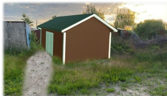
Ett nytt förråd uppförs nedanför bastubyggnaden

Grunden till en ny förrådsbyggnad för Byalaget är klar som Runnäs Bygg ska uppföra. Den kommer att användas till skrymmande och tunga attiraljer som används vid Byalagets arrangemang i parken däribland också redskap för skötsel av stranden och Strandpromenaden.