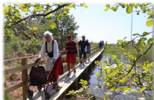
Strandpromenaden invigdes på nationaldagen 2023

Strandpromenaden och Badängsparken lyftes fram som önskvärda projekt av medlemmarna på byalagets höstmöte år 2019. Strandpromenaden färdigställdes och invigdes 2023. Underhållet sköts av Byalaget. Skyltarna har än så länge inte krävt mycket underhåll men frivilliga har röjt gräs längs stigarna. I juli lade Byalaget ny flis på delar av stigen, flisen sponsrades av Moelven.